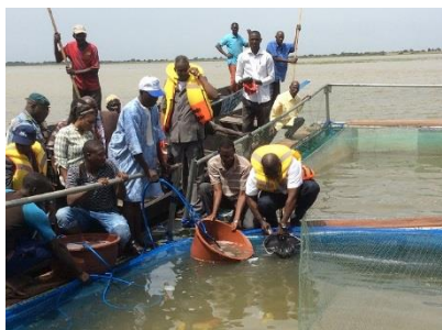
Empoisonnement du fleuve