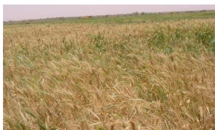
Champ de blé