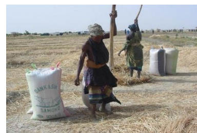
Battage du blé