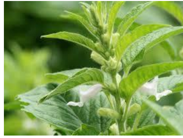
Plant de sésame