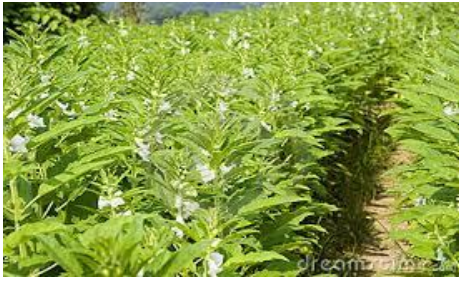
Champ de sésame