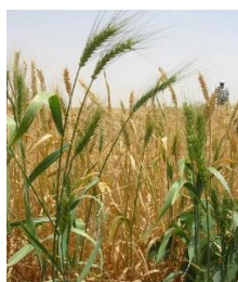
Plante de blé