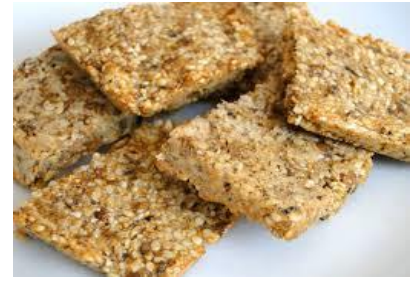
Biscuits à base de sésame