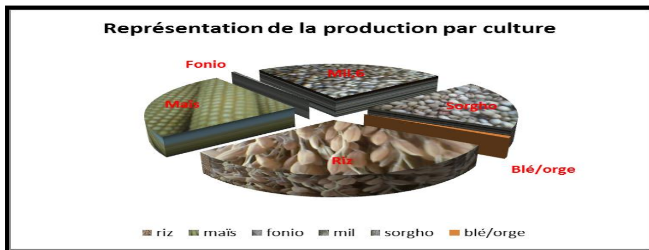
Graphique 1 : Les résultats de la production céréalière par culture

En comparant les résultats définitifs de la production céréalière globale de la campagne 2014/2015 aux besoins de consommation de la population malienne, suivant les normes de consommation de la FAO ( 214 kg/personne/an ), il se dégage un excédent céréalier, estimé à 1 831 330 tonnes .